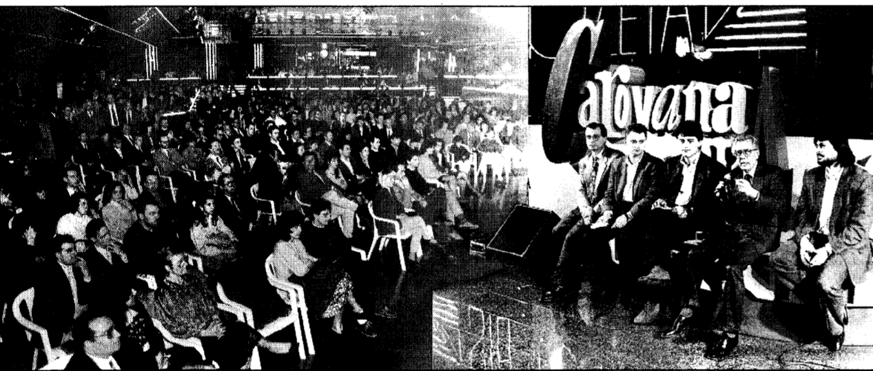
Arnaldo Forlani durante l'incontro con i giovani allo Studio Zeta, particolarmente affollato.

CARAVAGGIO - Allo «Studio Zeta» l'on. Arnaldo Forlani è arrivato solo alle 20,15, piuttosto in ritardo rispetto al programma. Niente di male, comunque. Il «botta e risposta» con i giovani che affolla-