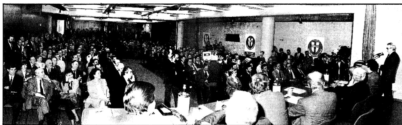
Una veduta del salone durante l'intervento di Forlani alla presentazione dei candidati DC.